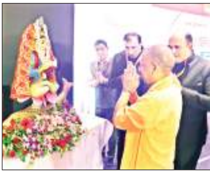
यूपी के सीएम योगी सिंधी काउंसिल ऑफ इंडिया द्वारा आयोजित दो दिवसीय राष्ट्रीय सिंधी अधिवेशन में शामिल हुए।