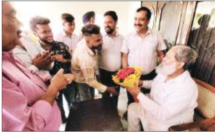
उनका धन्यवाद व्यक्त किया। उद्योगपतियों व कारोबारियों ने कहा कि गृह मंत्री अनिल विज की बंदौलत अम्बाला की शान में अब चार चांद लग गए हैं और जल्द

हरियाणा के गृह एवं स्वास्थ्य मंत्री अनिल विज के प्रयासों से अम्बाला में डोमेस्टिक एयरपोर्ट के शिलान्यास की तारीख 15 अक्टूबर तय होने पर अम्बाला में जश्न का माहौल है। विभिन्न बाजार एसोसिएशनों के अलावा व्यापारिक एवं अलग-अलग संगठनों के पदाधिकारी गृह मंत्री अनिल विज का धन्यवाद जताने के लिए लगातार उनके आवास पर पहुंच रहे हैं। इंडस्ट्रियल एरिया अम्बाला छावनी से कई उद्योगपतियों के अलावा, सदर बाजार से दर्जनों व्यापारी, राय मार्केट बाजार एसोसिएशन, तोपखाना से विभिन्न संगठन एवं दुकानदार गृह मंत्री अनिल विज के आवास पहुंचे और एयरपोर्ट की सांगत देने के लिए